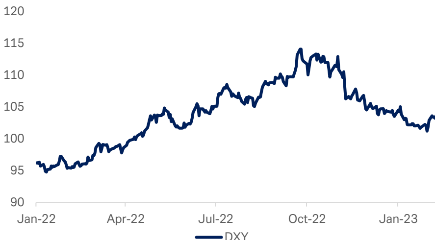
Gráfico 1: Índice monetario del USD

Fuente: Bloomberg Finance L.P., Deutsche Bank AG. Datos a 13 de febrero de 2023